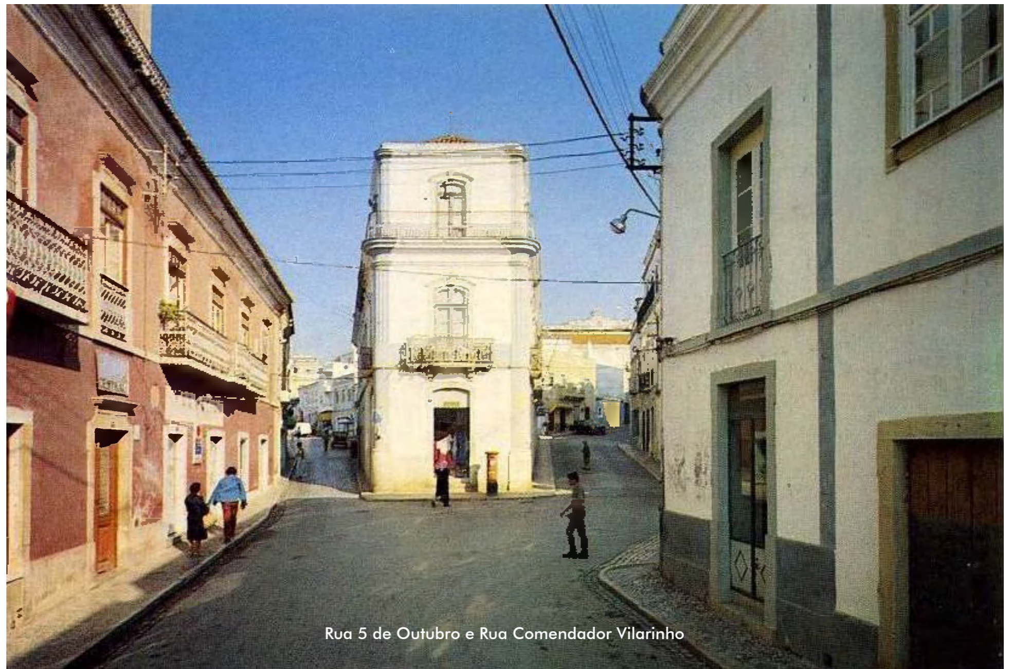
Rua 5 de Outubro e Rua Comendador Vilarinho

Após a revolução de 5 de outubro, a 11 de janeiro de 1911 o novo executivo, sob a presidência do republicano António Vaz Mascarenhas, deliberou que “existindo n’esta cidade, diferentes ruas cuja denominação não se justifica no actual regime e desejando a Comissão manifestar a sua admiração pelos homens que mais contribuíram, uns pelas suas ideias liberaes, outros pelos seus constantes esforços para a implantação da Republica Portuguesa e bem assim comemorar o acto glorioso da implantação da mesma Republica” propôs alterações toponímicas que afetaram uma dezena de artérias da cidade: os largos Serpa Pinto e Nossa Senhora dos Mártires ficaram denominados de Largo da República e Largo Mártires da Pátria , as ruas do Pelourinho, da Sé, Cruz de Portugal, Nossa Senhora dos Mártires, do Rio, das Pimenteiras, das Amoreiras e Coronel Galhardo denominaram-se respetivamente Rua 5 de Outubro, Joaquim António de Aguiar, Cândido dos Reis, Miguel Bombarda, José Estevão, Heliodoro Salgado, Elias Garcia e Marquês de Pombal 13 . Esta última denominação acabou por ser revogada 14 , devido aos relevantes serviços prestados à nação pelo brioso Coronel Galhardo.