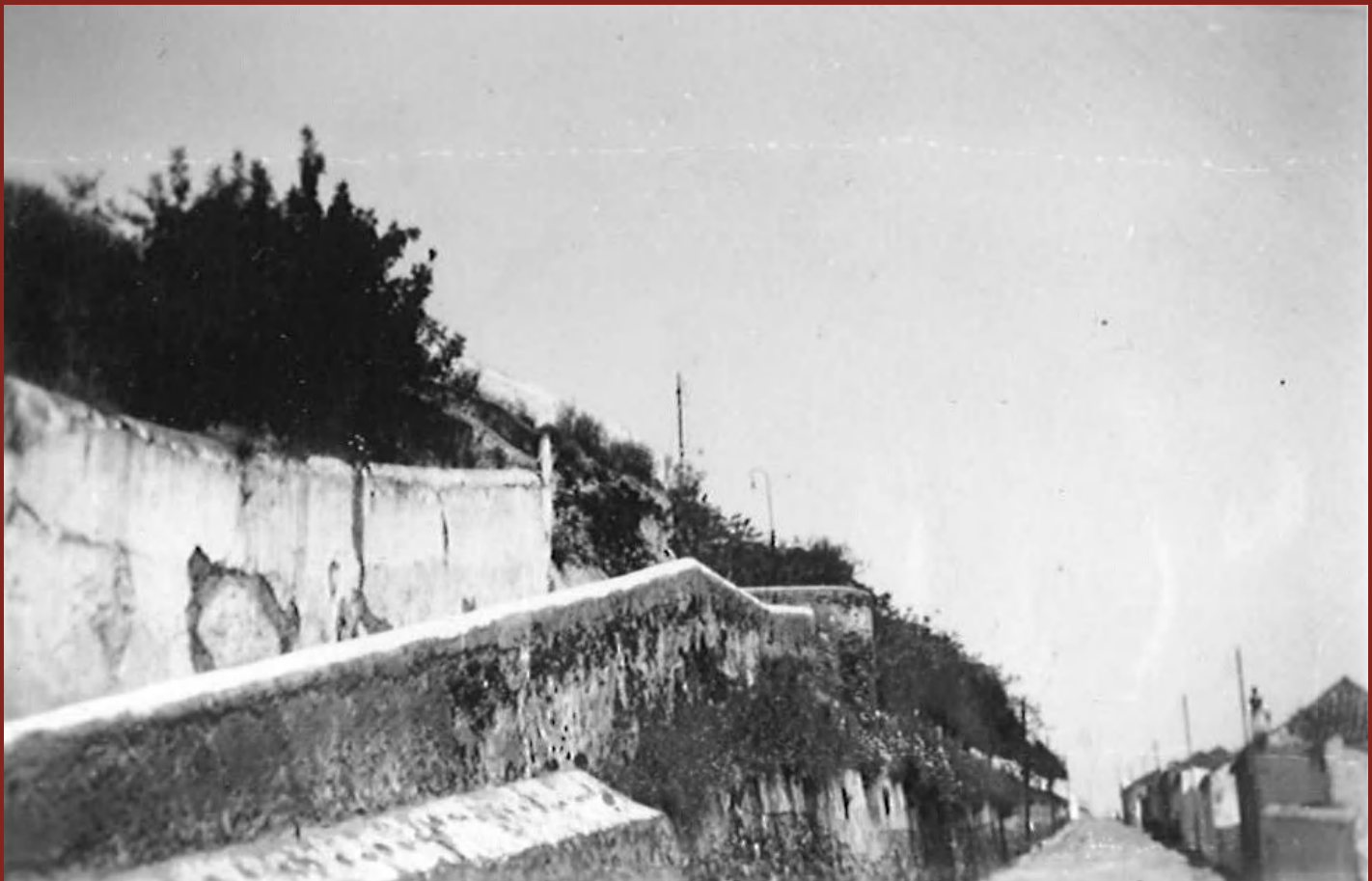
Rua do Mirante