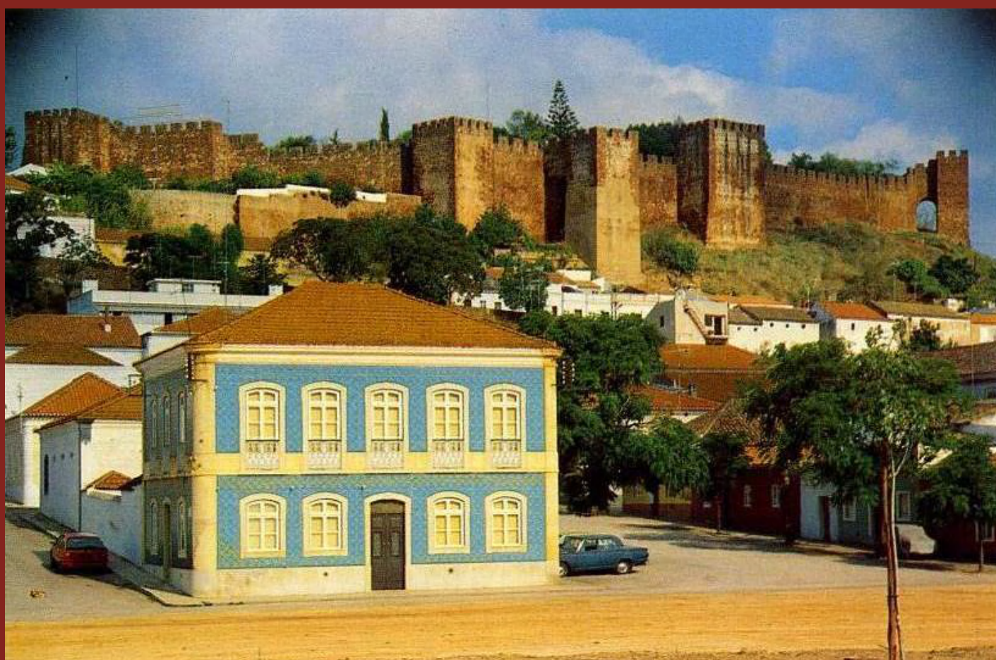
Largo Conselheiro Magalhães Barros, Rua Cruz de Portugal e Rua José Falcão