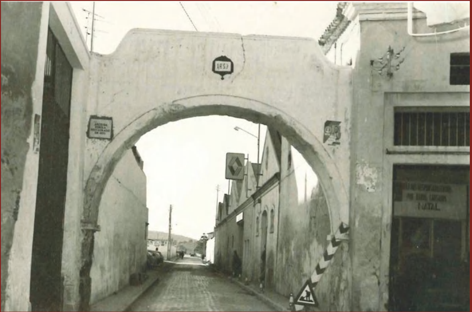
Rua Cruz da Palmeira