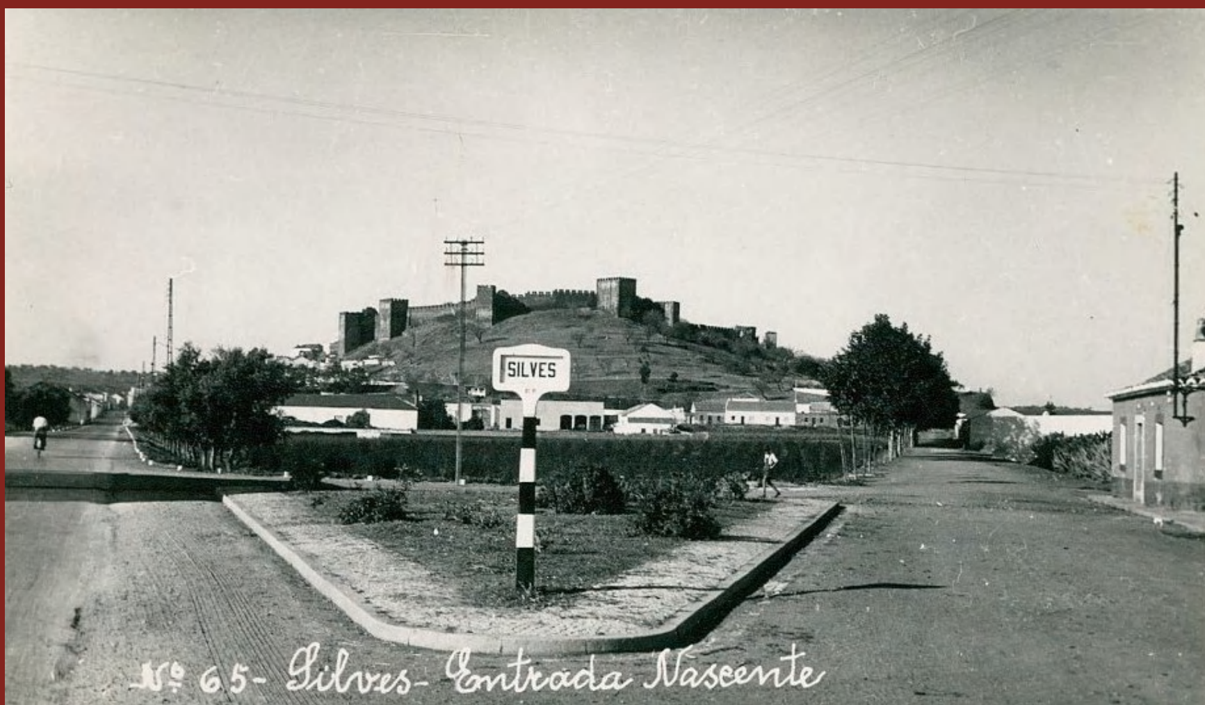
Rua Cândido dos Reis e Rua do Cemitério