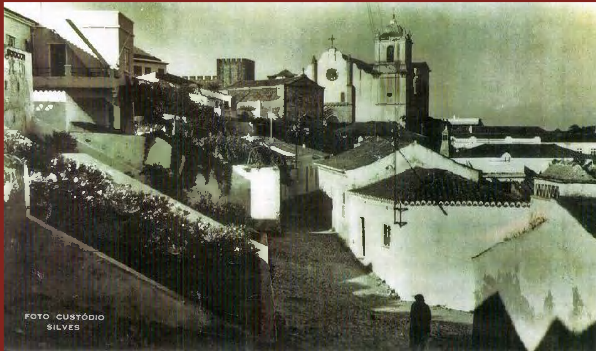
Travessa da Cató